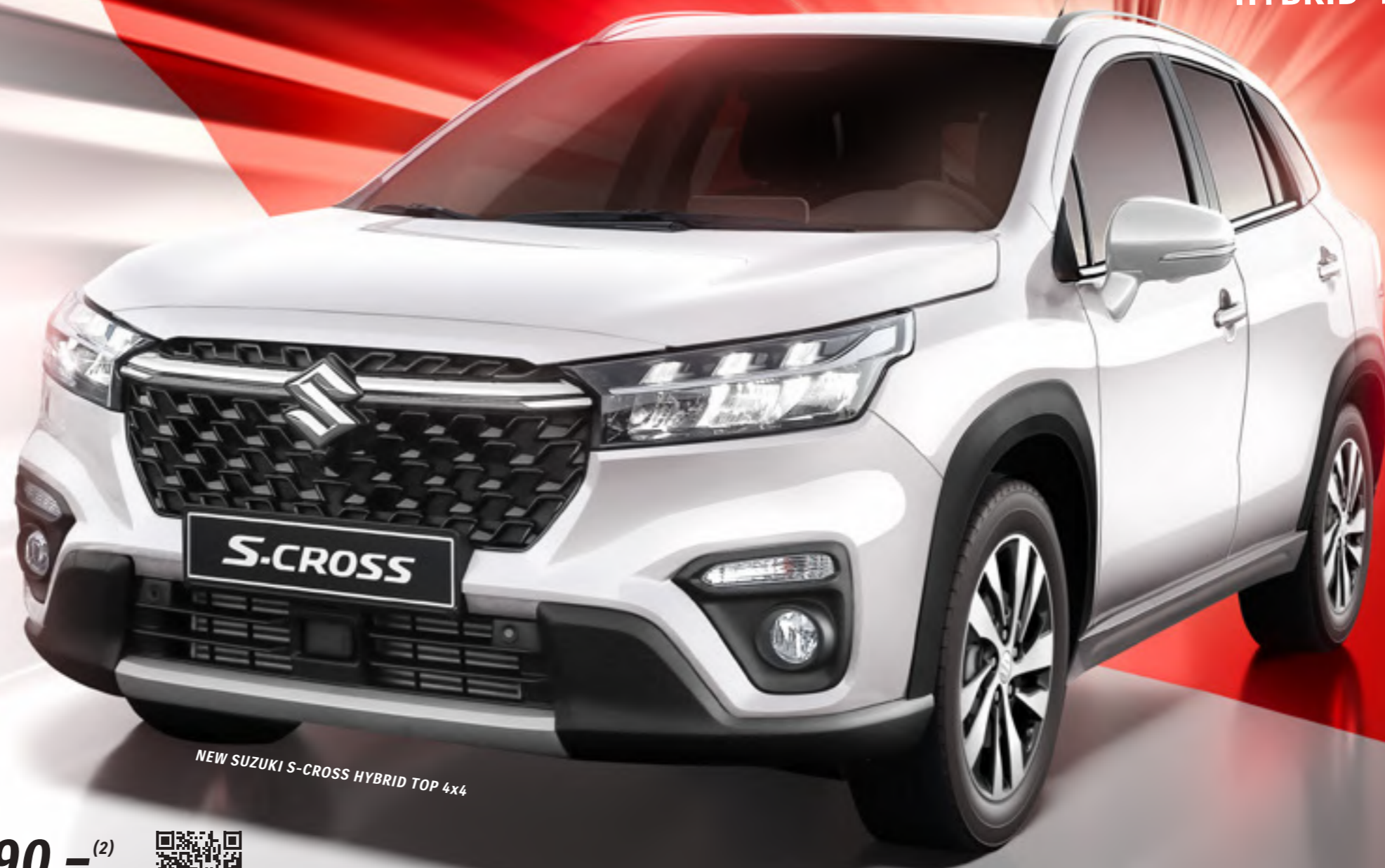
NEW SUZUKI S-CROSS HYBRID TOP 4x4

Le toit panoramique coulissant extra-large laisse entrer beaucoup de lumière et d'air dans l'habitacle.