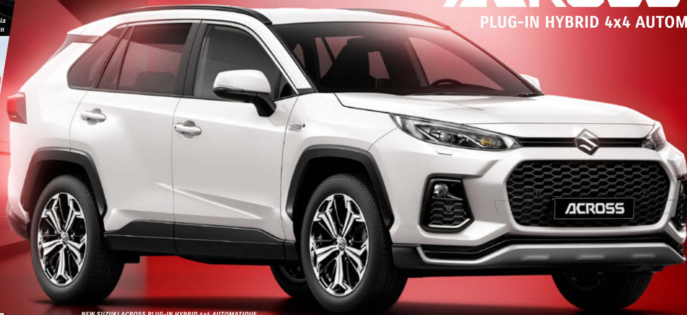
NEW SUZUKI ACROSS PLUG-IN HYBRID 4x4 AUTOMATIQUE

Aujourd'hui un SUV compact innovant, c'est un système hybride ultramoderne qui combine l'efficacité du carburant avec des émissions réduites de CO 2 , et qui offre une nouvelle expérience de conduite grâce à une grande réactivité allée à une accélération homogène. Équipé d'une traction intégrale électronique, il affiche des performances et une efficacité sans compromis. La fonctionnalité et la finition de qualité supérieure parlent d'elles-mêmes. Le NEW SUZUKI ACROSS est une référence et se distingue de la masse. Sa carrosserie robuste, son design sportif et sa face avant affirmée lui confèrent une allure unique.