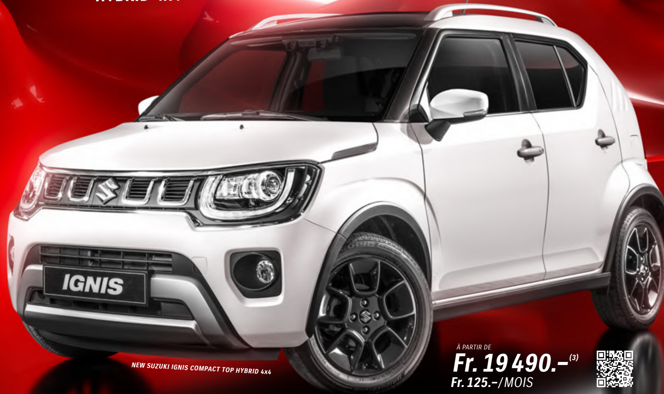
NEW SUZUKI IGNIS COMPACT TOP HYBRID 4x4