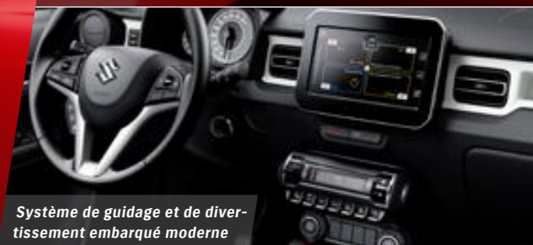
Système de guidage et de divertissement embarqué moderne

Également disponible avec boîte automatique (uniquement 2WD)