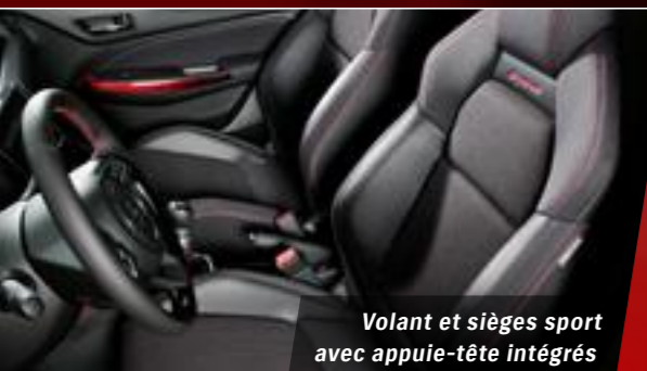
Volant et sièges sport avec appuie-tête intégrés