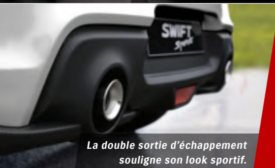
La double sortie d'échappement souligne son look sportif.

À PARTIR DE Fr. 26 990.- (7) Fr. 169.-/MOIS