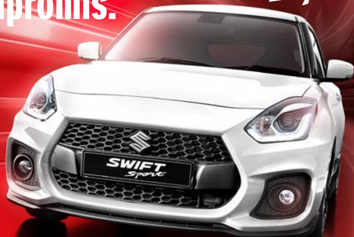
NEW SUZUKI SWIFT SPORT COMPACT TOP HYBRID