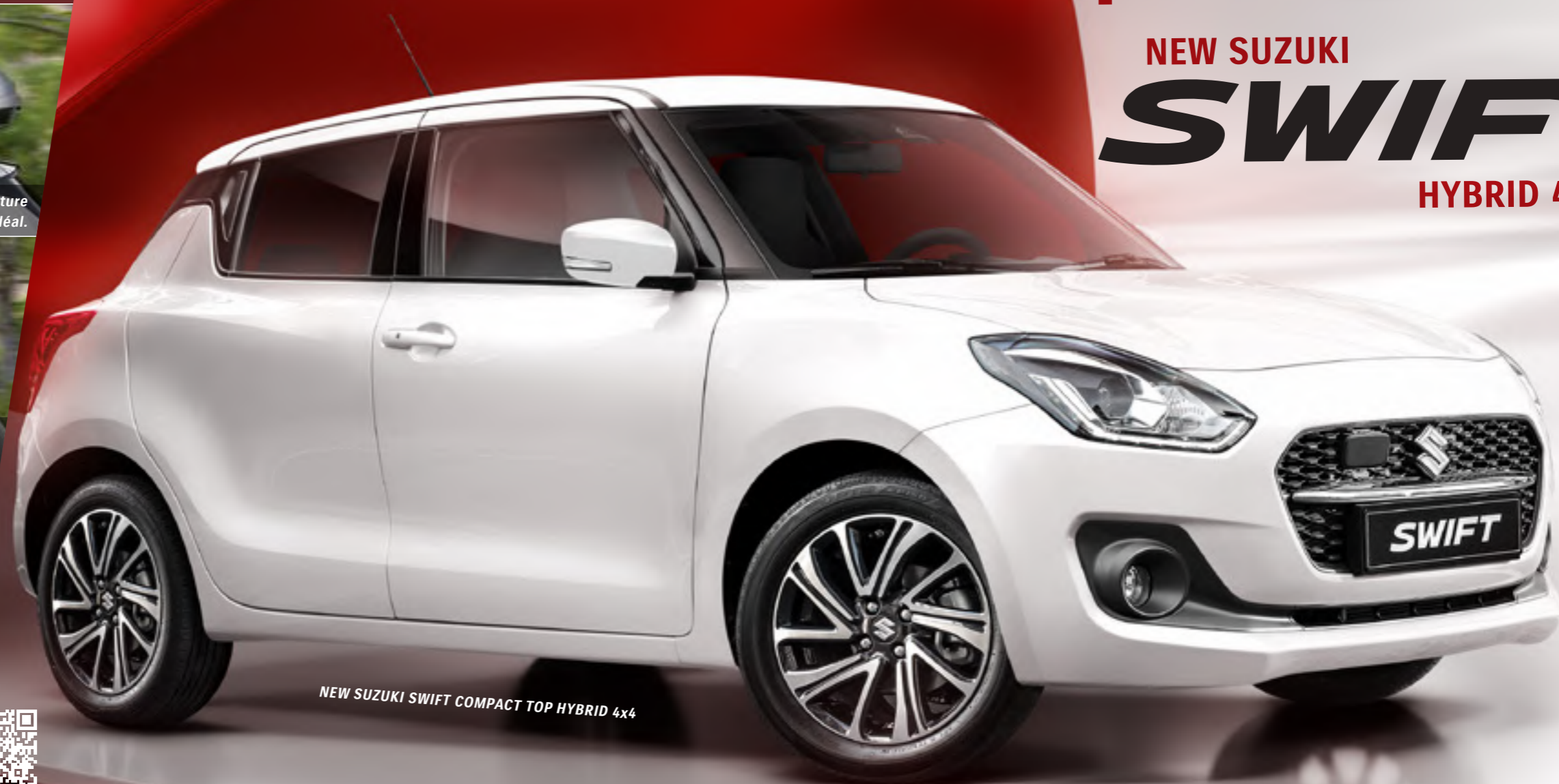
NEW SUZUKI SWIFT COMPACT TOP HYBRID 4x4

Programme individuel Suzuki: soulignez l'esthétique et le caractère sportif.