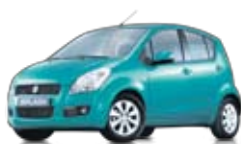
New Splash bereits für Fr. 14 990.- (1.0 GA, 5-türig)