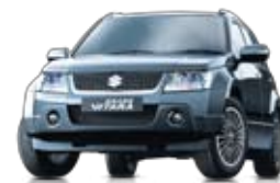
New Grand Vitara bereits für Fr. 29 990.- (1.6 GL 4x4, 3-türig)

Immer mehr Walliserinnen und Walliser setzen auf die Vorzüge des führenden Kompaktfahrzeugherstellers der Welt und insbesondere auf die Kompetenz von Suzuki im Bereich intelligenter und effizienter 4x4-Antrieb. Keine andere Marke war im Wallis im Februar so gefragt wie die kompakte Nr. 1. Dafür möchten wir uns bei allen Suzuki-Kunden ganz herzlich bedanken und gratulieren allen unseren Partnern im Kanton Wallis zu diesem hervorragenden Resultat.