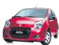
New Alto bereits für Fr. 12 990.- (1.0 GA, 5-türig)