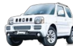
New Jimny bereits für Fr. 19 990.- (1.3 Country 4x4, 3-türig)