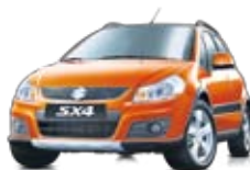
New SX4 bereits für Fr. 21 490.- (1.6 GL Streetline, 5-türig)