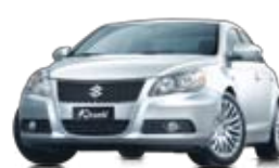
New Kizashi bereits für Fr. 39 990.- (2.4 GL Top 4x4, 4-türig)