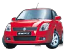
New Swift bereits für Fr. 15 990.- (1.3 GL, 3-türig)