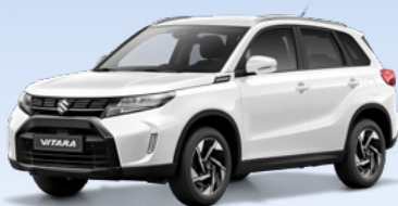
NEW VITARA 4x4