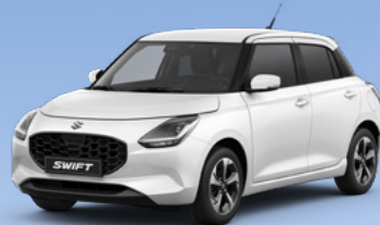
NEW SWIFT 4x4